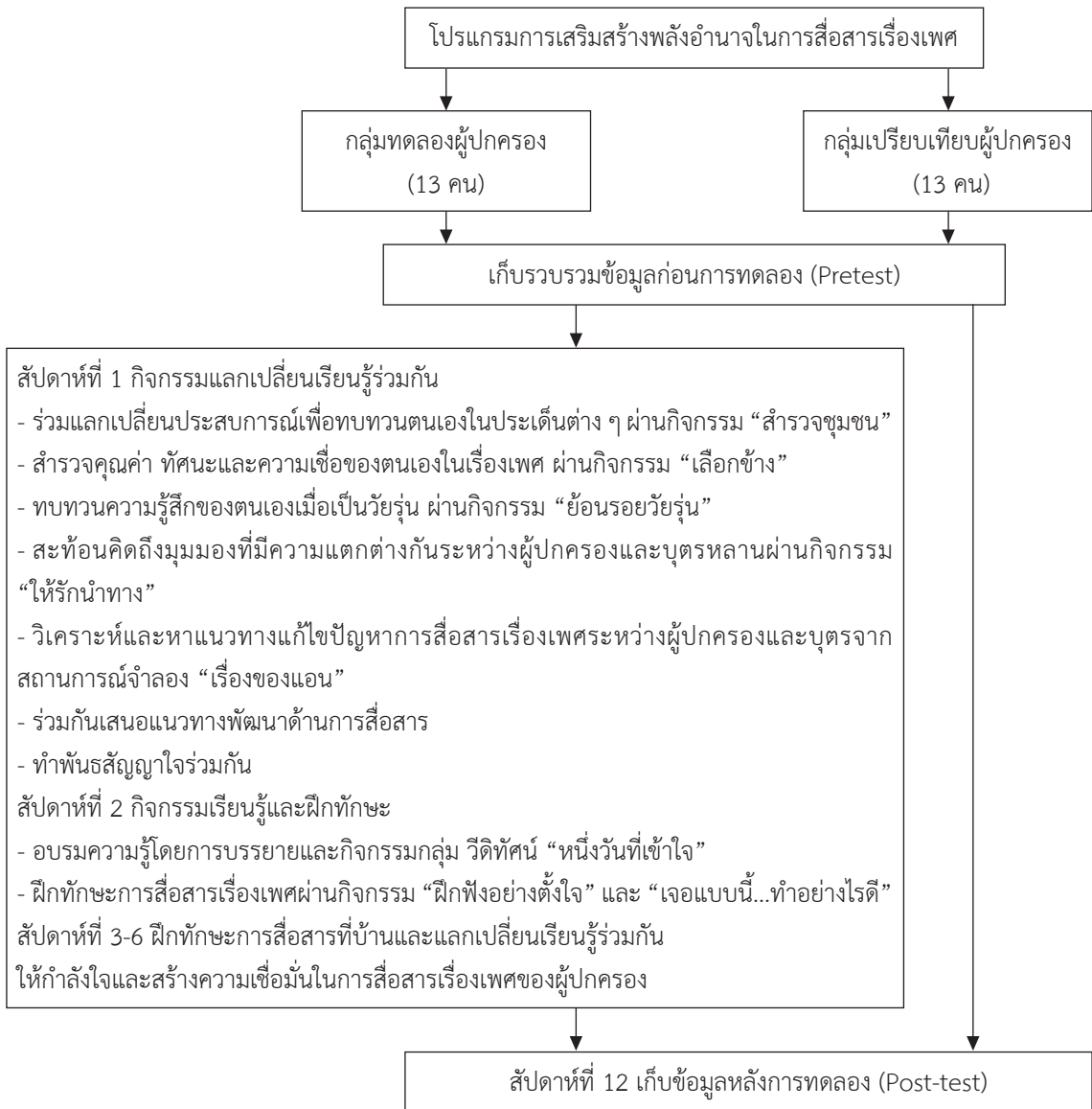
ภาพที่ 2 ขั้นตอนการทดลอง